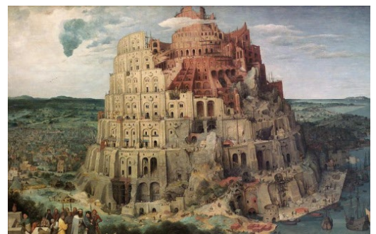
Peter Brueghel, La Grande Tour de Babel (1563)